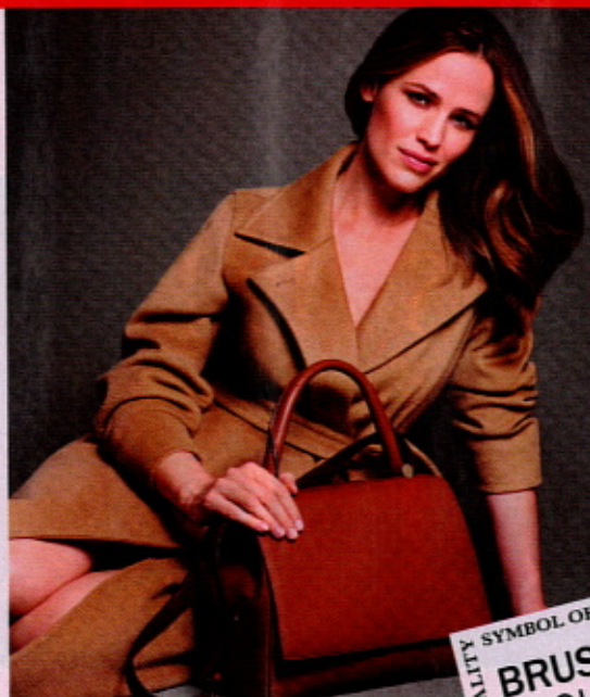
Jennifer Garner, première égérie pour MaxMara.

Un petit côté androgyne des années 1980 pour la collection hiver 2013.