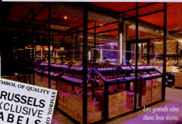
Les grands vins dans leur écriin.