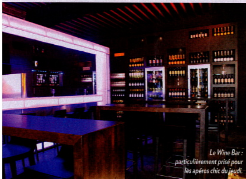
Le Wine Bar : particulièrement prisé pour les apéros chic du jeudi.